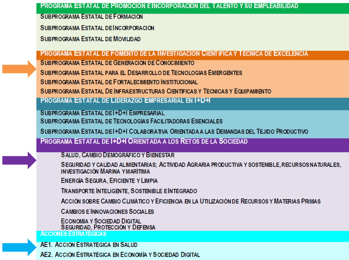
TABLA 3. Programas Estatales y Subprogramas del PLAN ESTATAL DE INVESTIGACIÓN CIENTÍFICA Y TÉCNICA Y DE INNOVACIÓN 2013-2016.